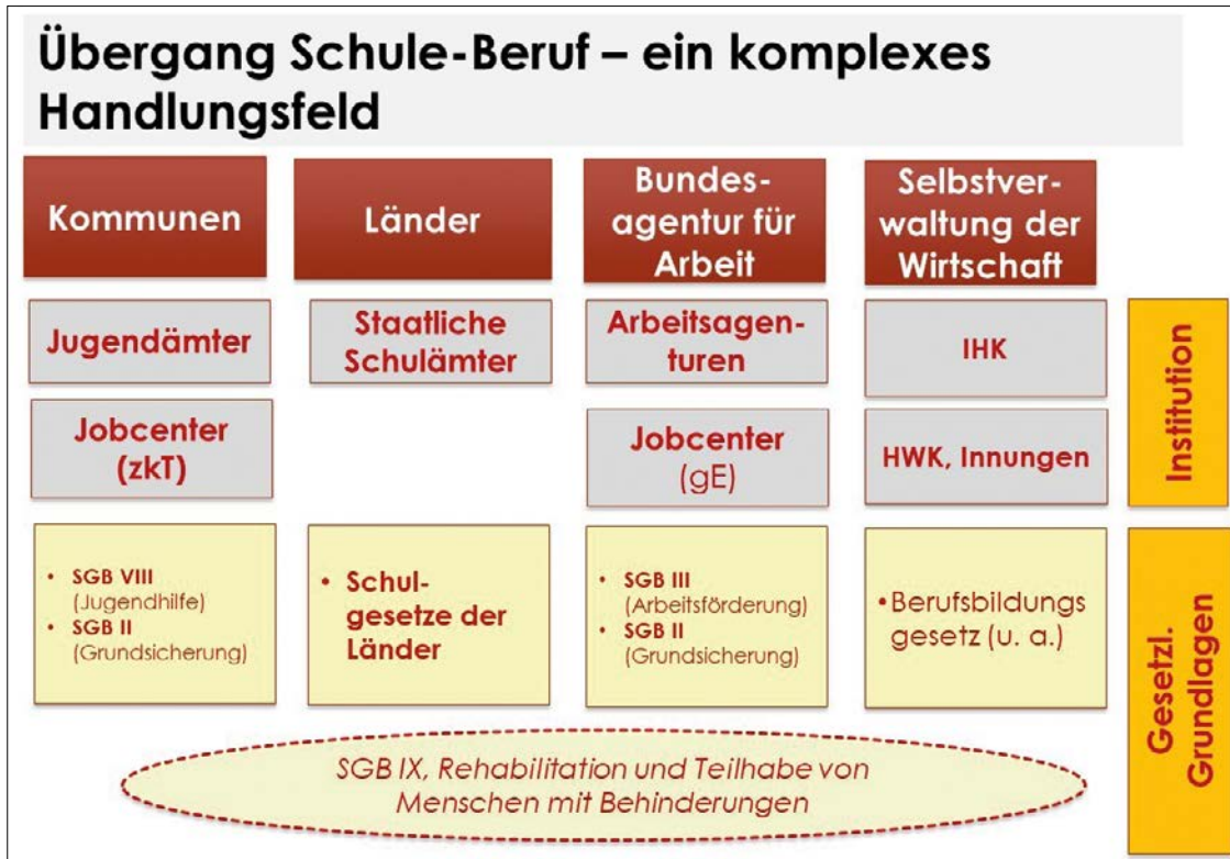
Abb. 1: Übergang Schule – Beruf

chen selbst noch allen anderen Akteuren, seien es Lehrkräfte, Eltern, engagierte Menschen in Vereinen oder in Betrieben, leicht macht, sich zu orientieren und die richtige Hilfe zu finden, die auf die besondere Problemsituation der Jugendlichen passt.